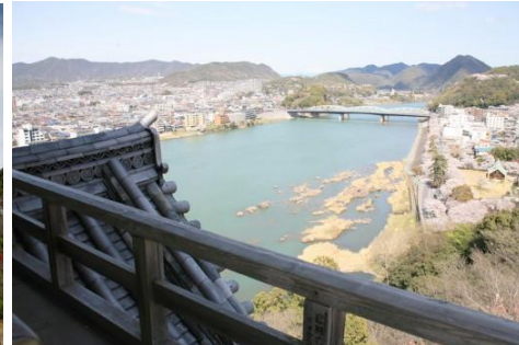
犬山城の上から見える景色