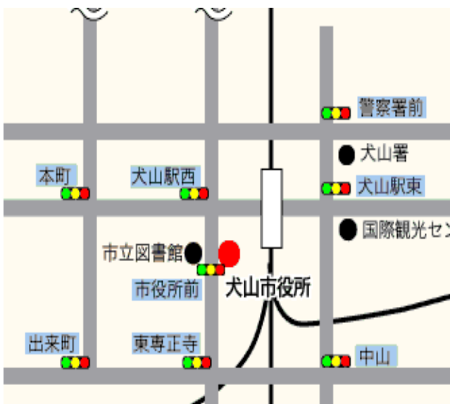
↑ Mapa de la municipalidad de Inuyama