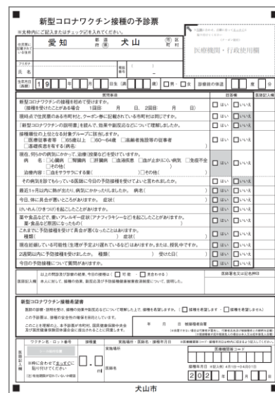
EXAME MÉDICO PRELIMINAR