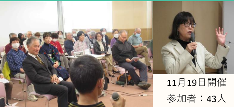
11月19日開催 参加者：43人