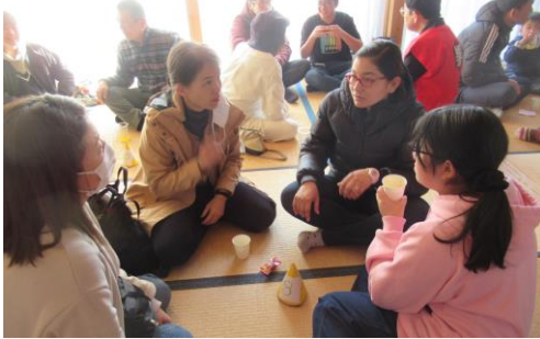
3月3日開催 参加者：6か国 34人

にほん わだいこ 日本の和太鼓と ペルーのカホー たい ン、ダンスを体 けん こ おとな 験。子ども大人 いっしょ たの も一緒に楽しみ ました。かくくに 各国の がっき おんがく 楽器や音楽につ いても話し合い ました。