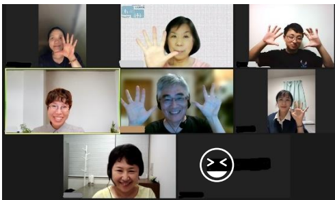
「多文化聊天俱乐部～视频方式」

每个月举办一个小时的交流会，在这里大家一起决定题目，平等的讨论和交换意见。跟不同国家的人交流会发现很多新东西。