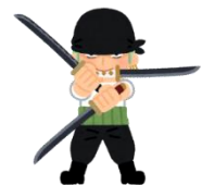
Roronoa Zoro (ONE PIECE)