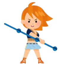
Nami (ONE PIECE)