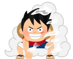
Monkey D Luffy (ONE PIECE)

每年的8月份，爱知县名古屋市都会举办漫展，各种动漫人物的角色扮演者都会聚集在这里。也能在名古屋大须商店街看到动漫角色扮演者的游行。