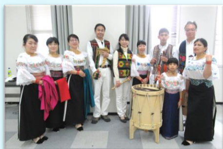
Apresentação ao Vivo da Dança e Música Folclórica do Equador

Local: Centro Internacional de Turismo de Inuyama 「Froide」1º andar e 4º andar