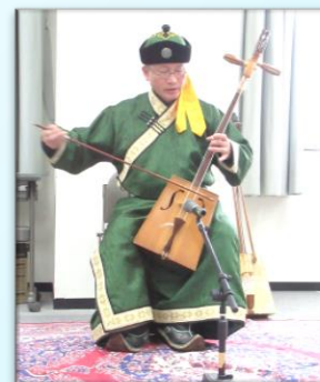
Instrumento Musical do Folclore Mongol

Festival do Froide é um festival de intercâmbio internacional. O tema deste ano é “ Juntos rumo a Novos Tempos com o objetivo dos Japoneses e os estrangeiros possam ter a compreensão mútua das diferenças cultural e de intercâmbio multicultural