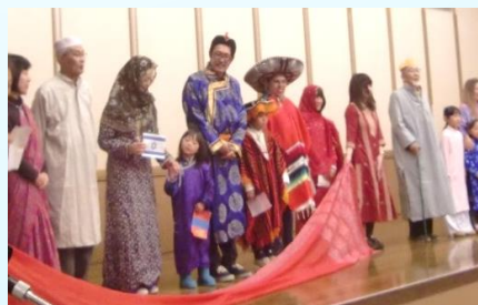
Desfile de Trajes Típicos