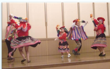
Dança Folclórica do Perú