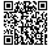
↑ Trung tâm Giao lưu Cư dân thành phố Inuyama "Freude"

Có phiên dịch viên tiếng Việt/ tiếng Tagalog/ tiếng Trung/ tiếng Bồ Đào Nha/ tiếng Tây Ban Nha/ tiếng Anh