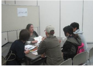
ランゲージカフェ(無料オープン講座)