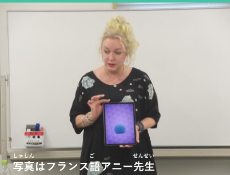
写真はフランス語アニー先生

ねんど げんご 2025年度は7言語 20~21クラスの講 ざ かいこう しょ 座を開講でき、初 しんしゃ はばひろ 心者から幅広い かたがた かくげんご まな 方々が各言語を学