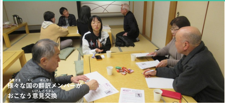
様々な国の翻訳メンバーが おこなう意見交換

じょうほうし さくせい ほんやく たげんご ほんやく 情報誌を作成し、翻訳メンバーが多言語に翻訳し、 ねん かい ほっしん はいふ ほっしん がつ がつ げんご ご 年2回発信・配布。発信：10月、3月、言語：ベトナム語、 ご ご ご えいご にほんご タガログ語、ポルトガル語、スペイン語、英語、やさしい日本語