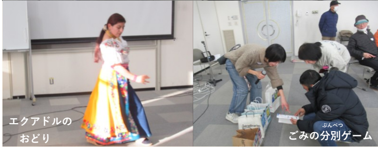
エクアドルの おどり