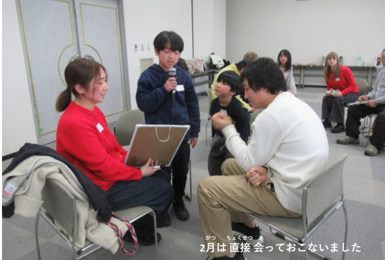
2月は直接会っておこないました