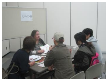
ランゲージカフェ(無料オープン講座)