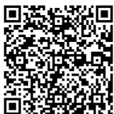
QR code do Web Site

《《COMO FAZER A RESERVA》》 Escolher uma das formas de reservar ①Prefeitura Municipal de Inuyama. Telefonar para Call Center 『Reservas・Informações』 ②Reservar pela Internet https://www.city.inuyama.aichi.jp/1006634/1007443/1007807.html Pode ser acessado também pelo QR code abaixo. Os idiomas são: japonês, inglês, chinês (tradicional e popular), português, espanhol, vietnamita, nepalense) ③Reserva no Balcão. ※Exclusivamente no período de 5 de Julho a 18 de Julho ※Não teremos intérpretes. locais : Prefeitura Municipal, Tounoji Kouminkan, Nambu Kouminkan, Gakuden Fureai Center Horário : 9 : 00~17 : 00