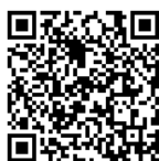
Instruções da Pfizer

As instruções sobre vacinas em português, poderão ser baixadas acessando código QR abaixo: